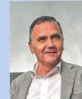
Benoît CEREXHE Bourgmestre Woluwe-St-Pierre